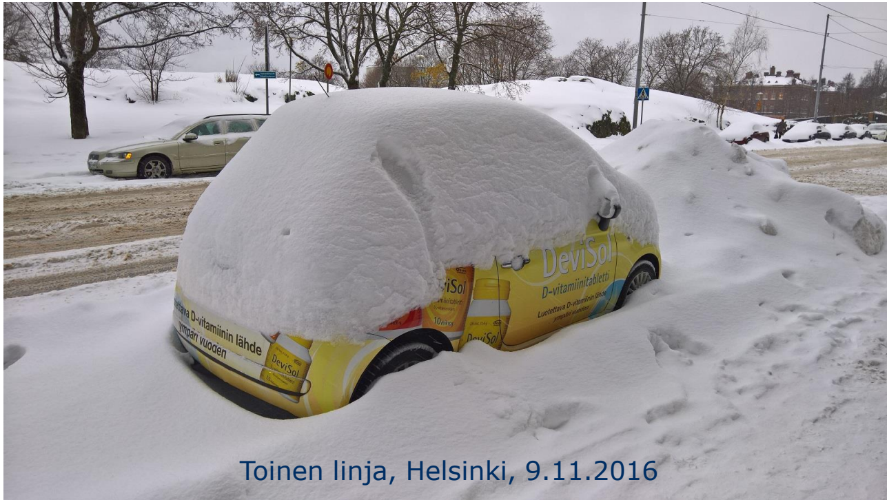
Toinen linja, Helsinki, 9.11.2016