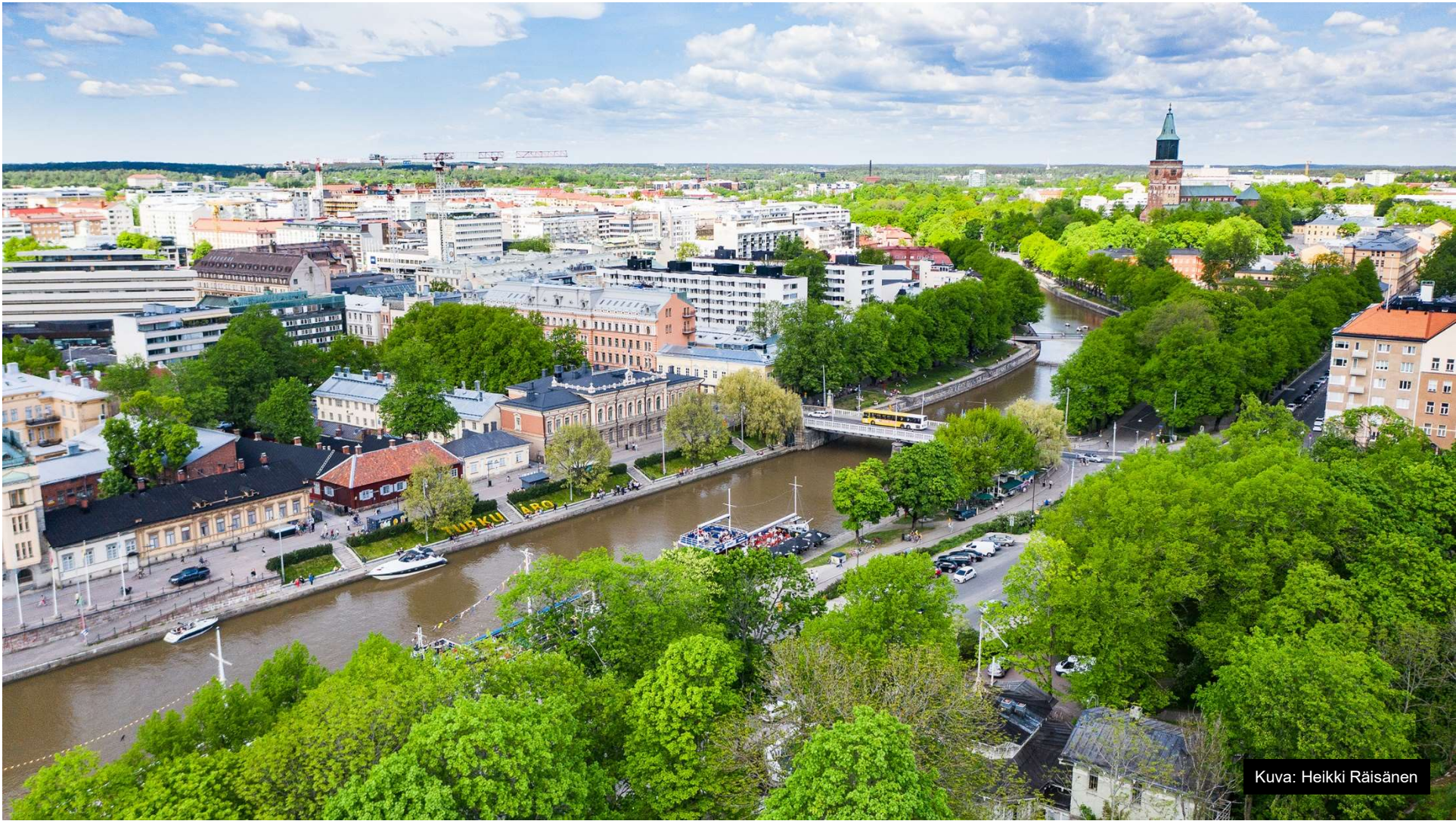
Kuva: Heikki Räisänen