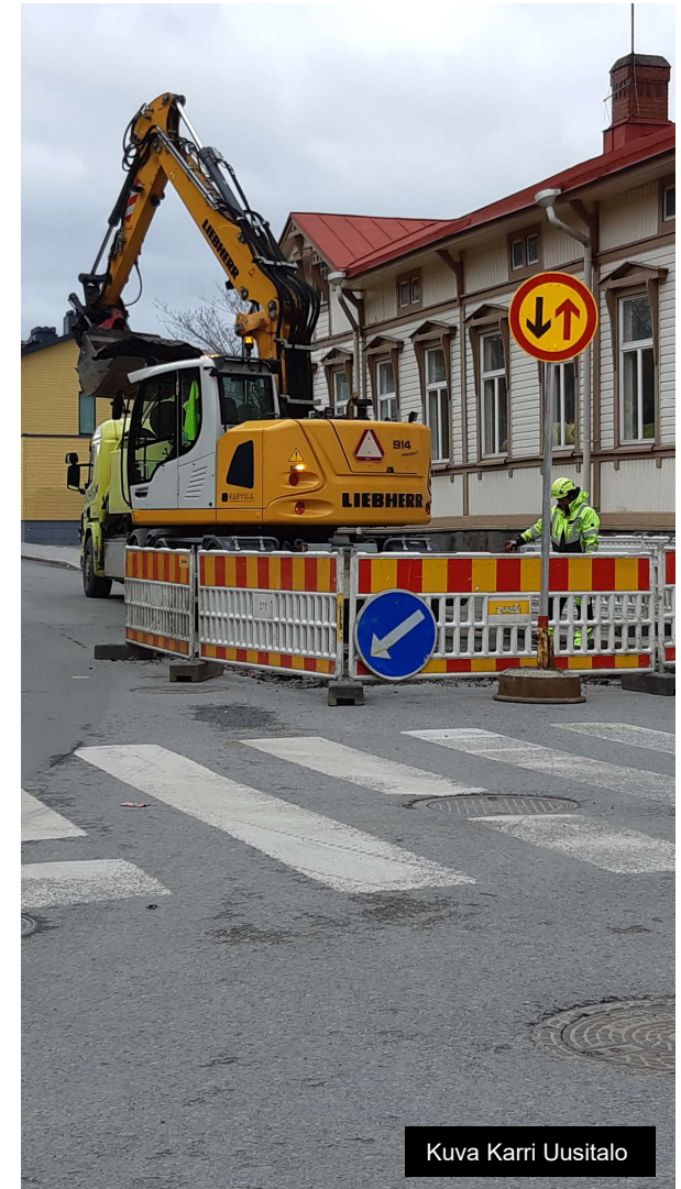
Kuva Karri Uusitalo